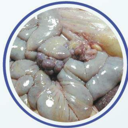
Hidrometra y cuerpos lúteos