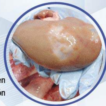
Tejido en reparación