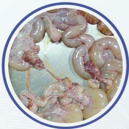
Aumento de tamaño del útero