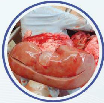
Quistes de diferente tamaño y forma