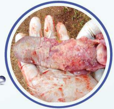
Desprendimiento de epitelio