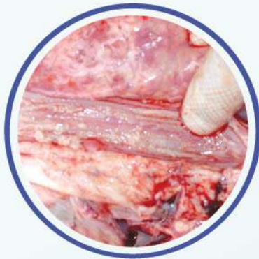
Esófago: irritación y placas blanquecinas