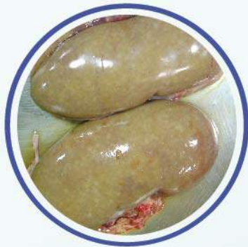
Puntillero blanquecino, aumento del tamaño